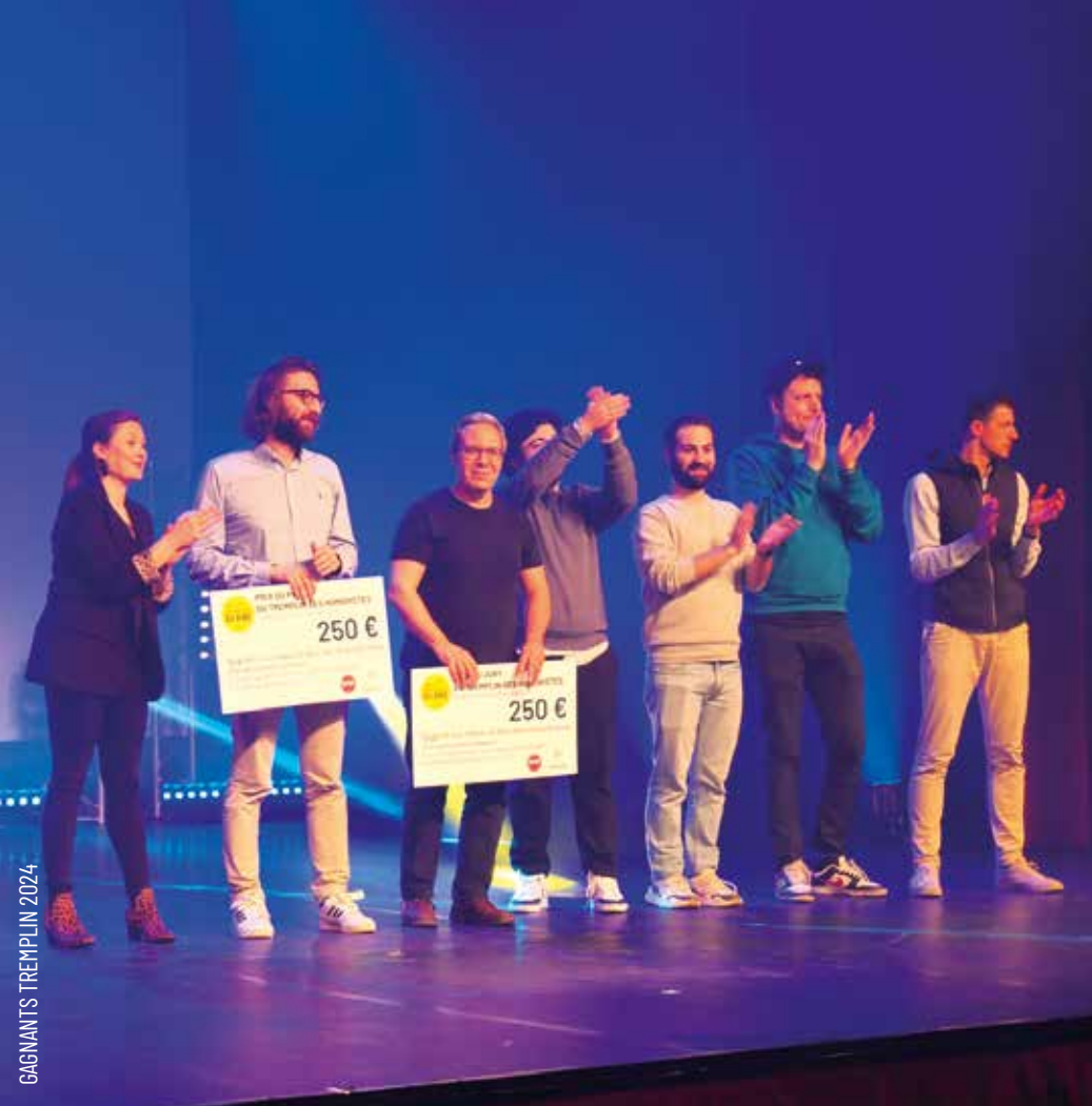
GAGNANTS TREMPLIN 2024