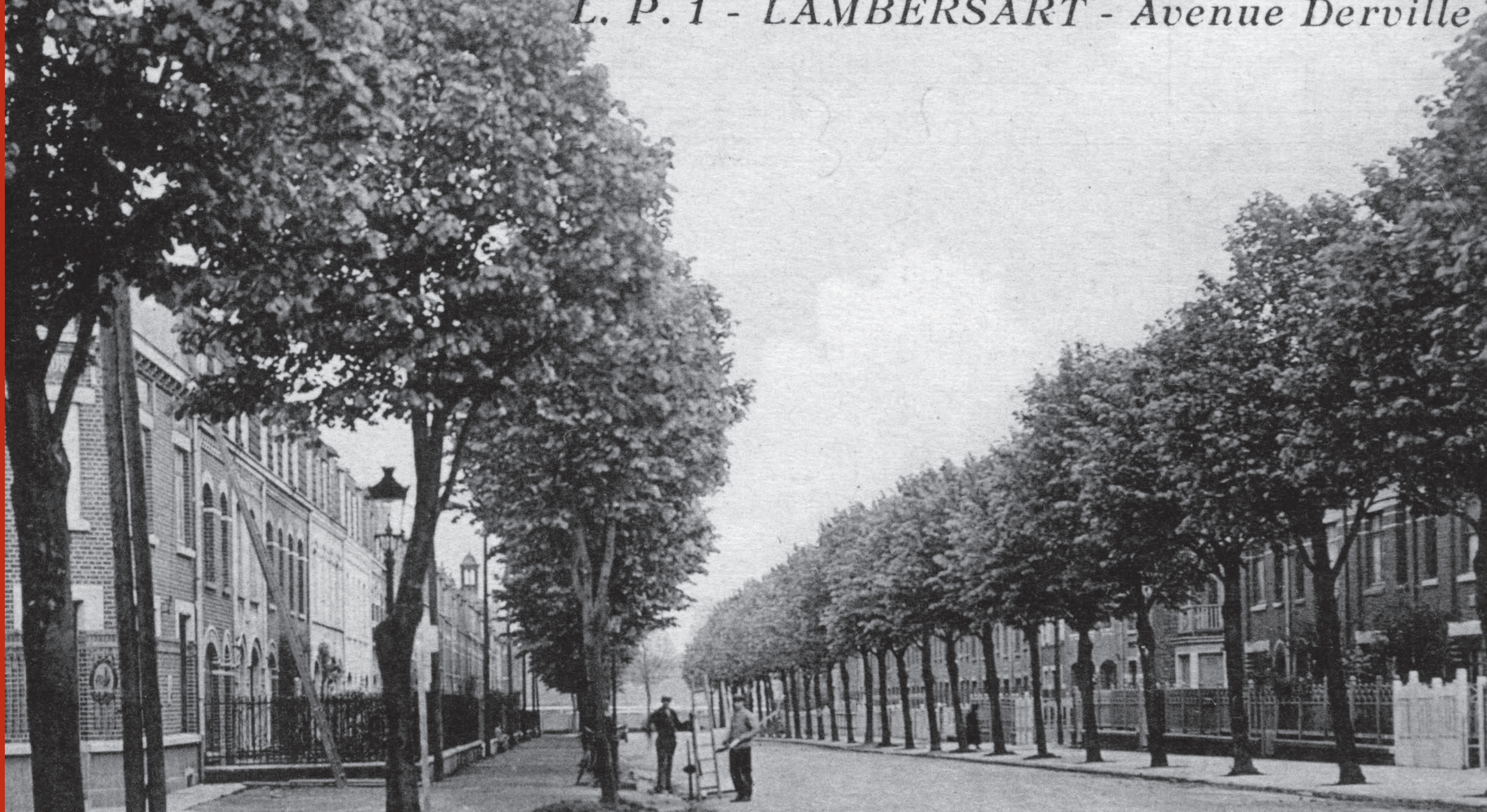
(1) carte postale : les HBM en 1929