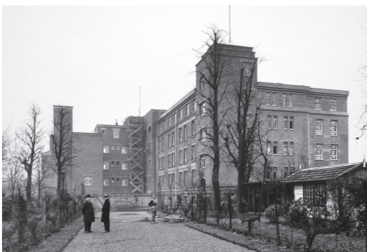
Clinique de la Roseraie en chantier, vue depuis l'avenue de l'Hippodrome en 1932 (n°262, actuelle caserne des CRS)

De 1932 à 1950, de nombreuses maisons de ville, villas, immeubles de rapport et bâtiments publics de styles Art Déco moderne, utilisent la brique de parement associée au ciment sur béton armé, les volumes, vitraux et ferronneries géométriques.