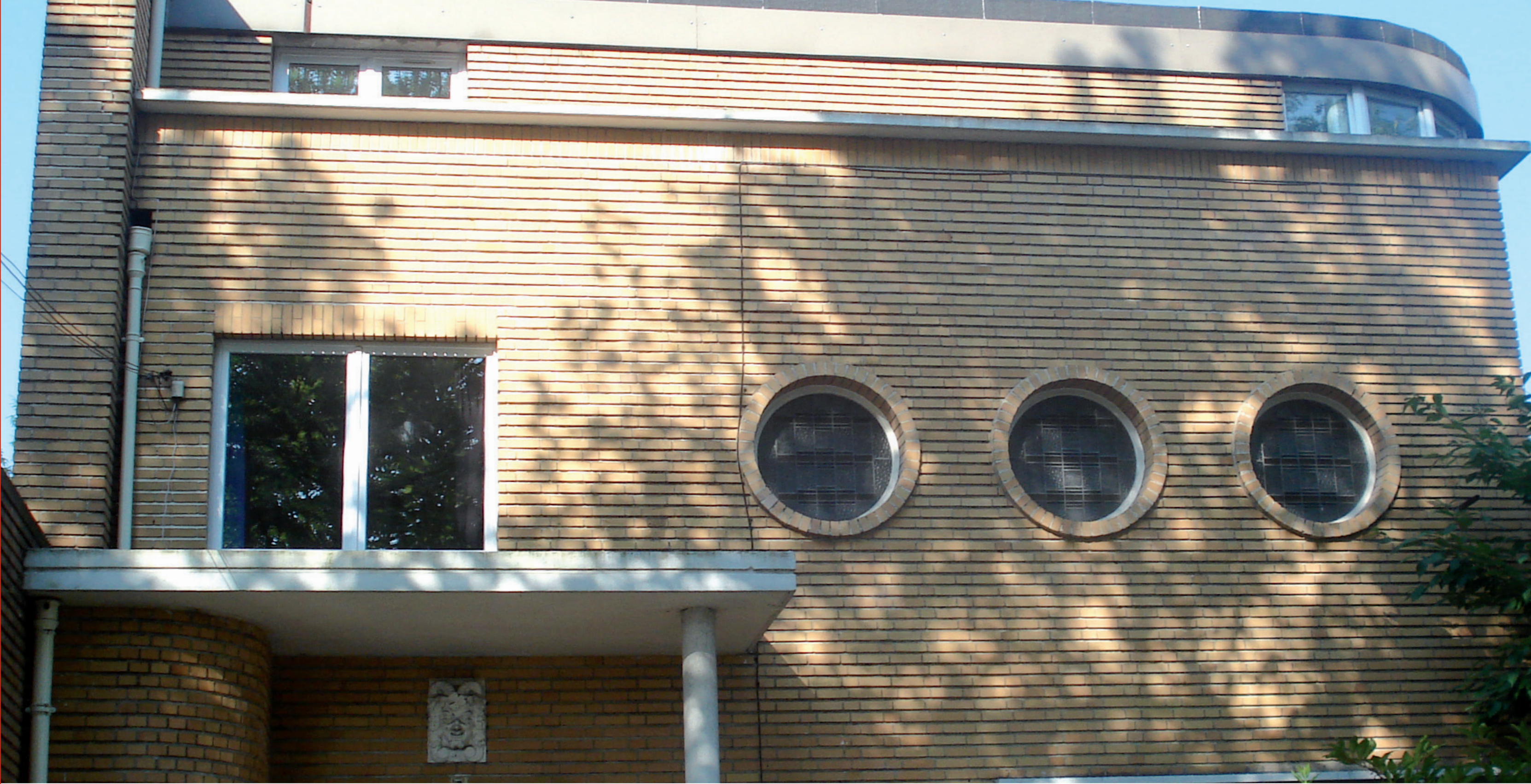
Villa Sdez côté avenue de l'Hippodrome