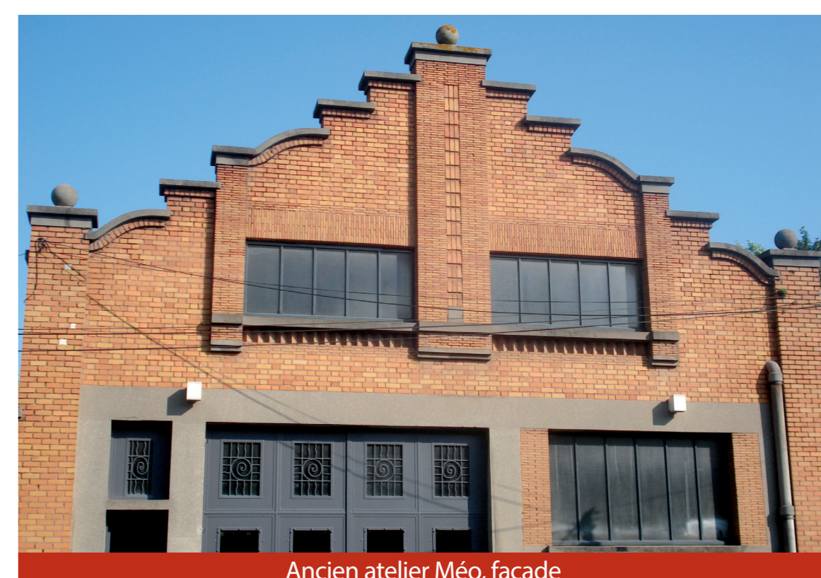
Ancien atelier Méo, façade

At the front, surrounded by its original park fence, the corner villa of 1947 of the Méauxsoones, founders of the Méo coffees, alternates briquettes and cement with superimposed concrete bow windows. The entrance porch is superbly treated. On the Avenue Foch, their studio and workshop of 1938 is distinguished by its sawtooth gables and ironwork.