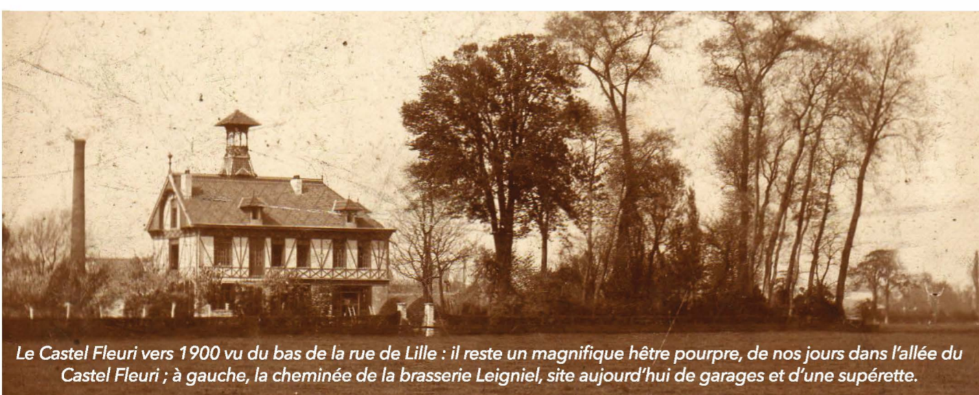
Le Castel Fleuri vers 1900 vu du bas de la rue de Lille : il reste un magnifique hêtre pourpre, de nos jours dans l'allée du Castel Fleuri ; à gauche, la cheminée de la brasserie Leigniel, site aujourd'hui de garages et d'une supérette.

Seule industrie du quartier, la brasserie Leigniel embauchait des ouvriers logés rue Crespi. Il ne reste de nos jours que son écurie, transformée en office notarial.