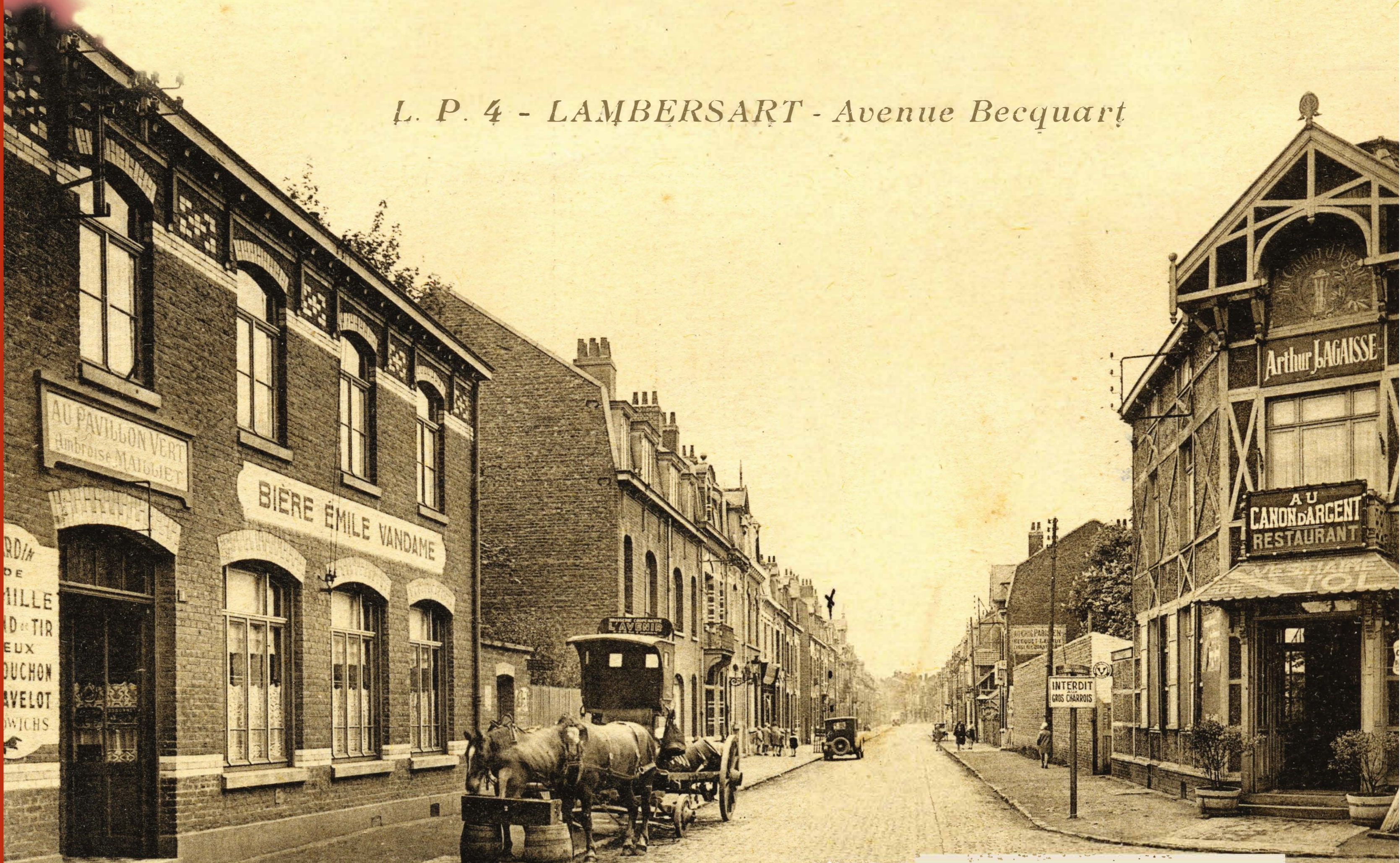
Carte postale de l'entrée de l'avenue Becquart vers 1925 : à droite, le café-restaurant du Canon d'Argent ouvert de 1895 à 1968 (dont l'enseigne nous rappelle le canon à boire), de nos jours un parking avec commerces ; à gauche, le cabaret « Au Pavillon vert » ; un attelage de chevaux livrant la bière Vandame fait une pause.