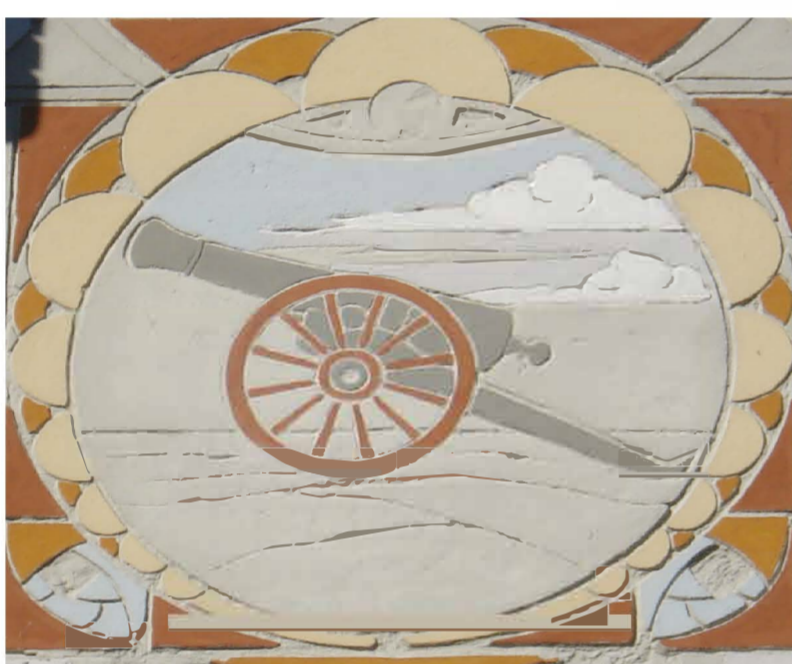
Médaille éponyme du Canon d'Or, sgraffite de 1910 toujours sur la façade du cabaret-spectacle ; l'escargot, situé avant la rénovation de 1964 au-dessus de l'entrée principale de gauche, a démantelé sur la face du toit.

The origin of the Canon d'Or neighbourhood