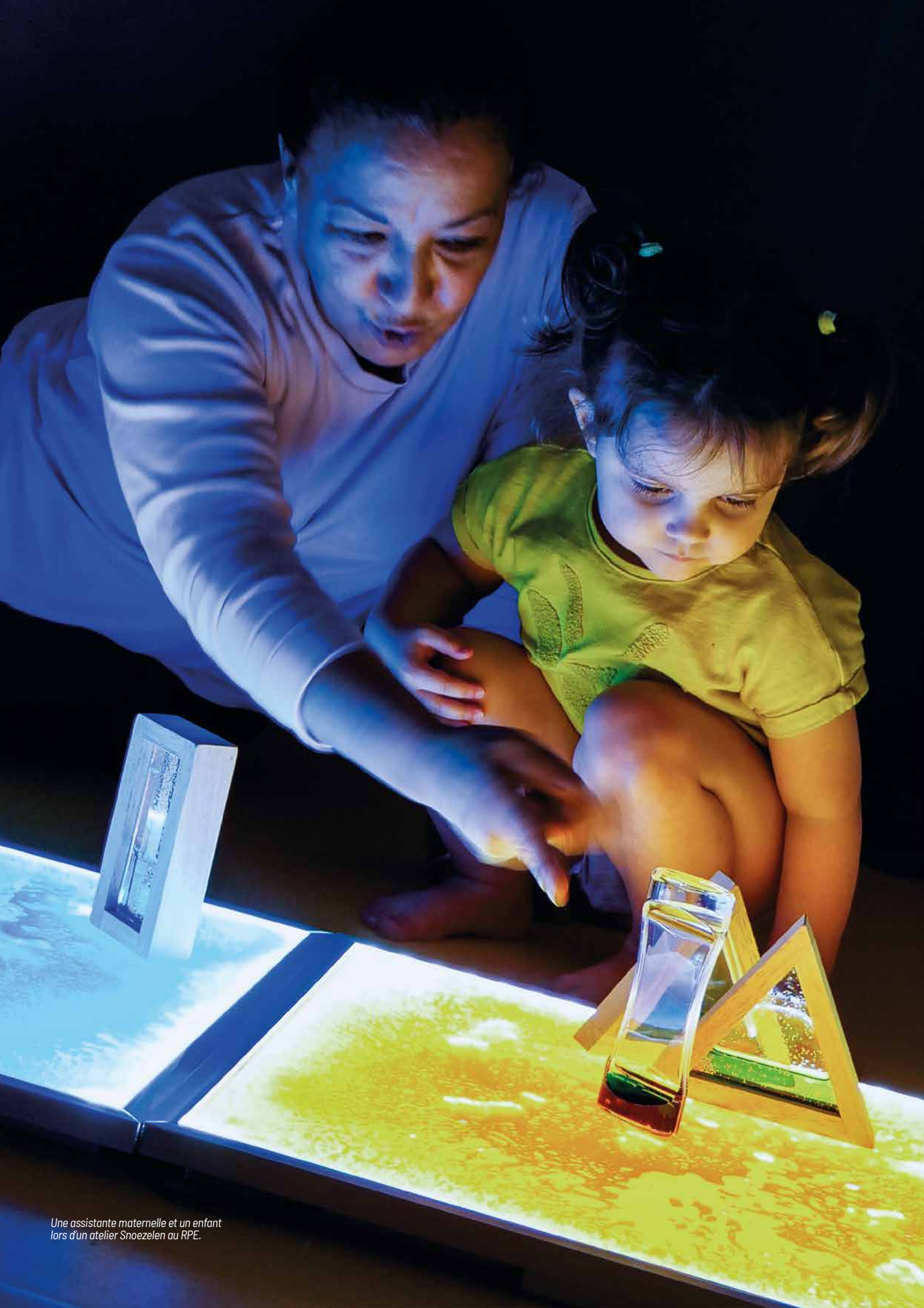
Une assistante maternelle et un enfant lors d'un atelier Snoezelen au RPE.