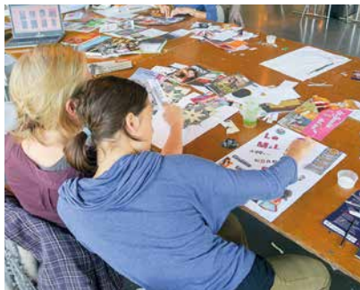
👉 Colysée : autour de l'expo "Gare aux monstres", des animations variées comme cet atelier affiches ados-parents le 7 octobre.