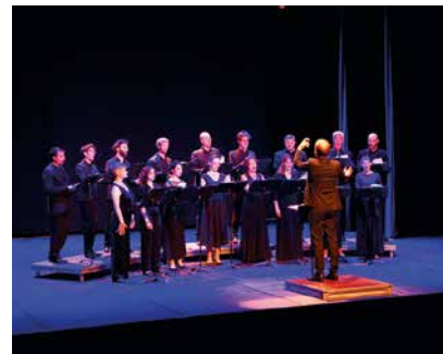
👉 Barbara & Brel a capella : Salle André Malraux, l'Ensemble Aedes a rendu hommage aux plus belles chansons de Barbara et Brel.