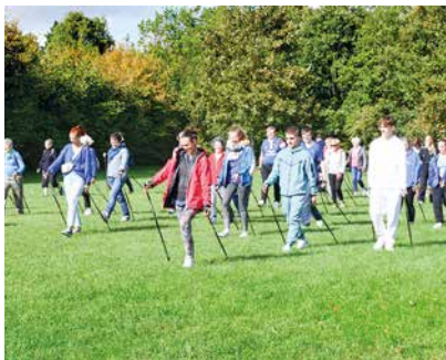
👉 Semaine Bleue : les nombreuses animations, comme ici la marche nordique, ont attiré les seniors lambersartois début octobre.