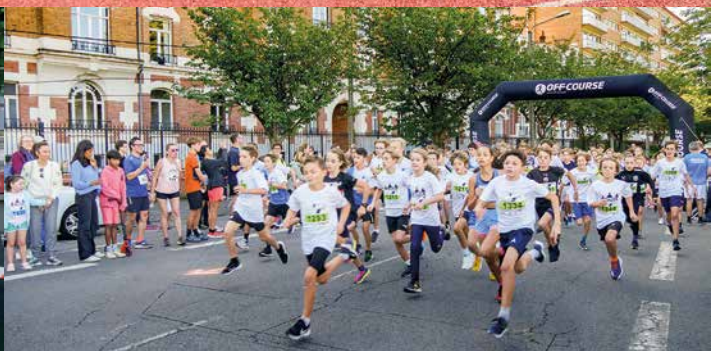
👉 Foulées lambersartois : dimanche 24 septembre, 1400 personnes ont pris le départ des différentes courses, 10 km, 5 km, 2024 m et 1 km, sous un beau soleil. Familles et amis étaient venus nombreux les applaudir tout le long du parcours renouvelé, jusqu'à leur arrivée au stade Guy-Lefort.