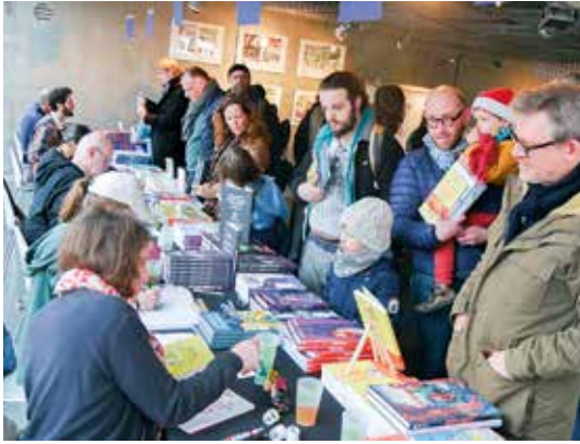
👉 Au Temps Buller : il y avait foule à la fête autour de la BD et des mangas organisée par la librairie Au temps Lire au Colysée, à l'occasion de sa réouverture le 1 er avril.