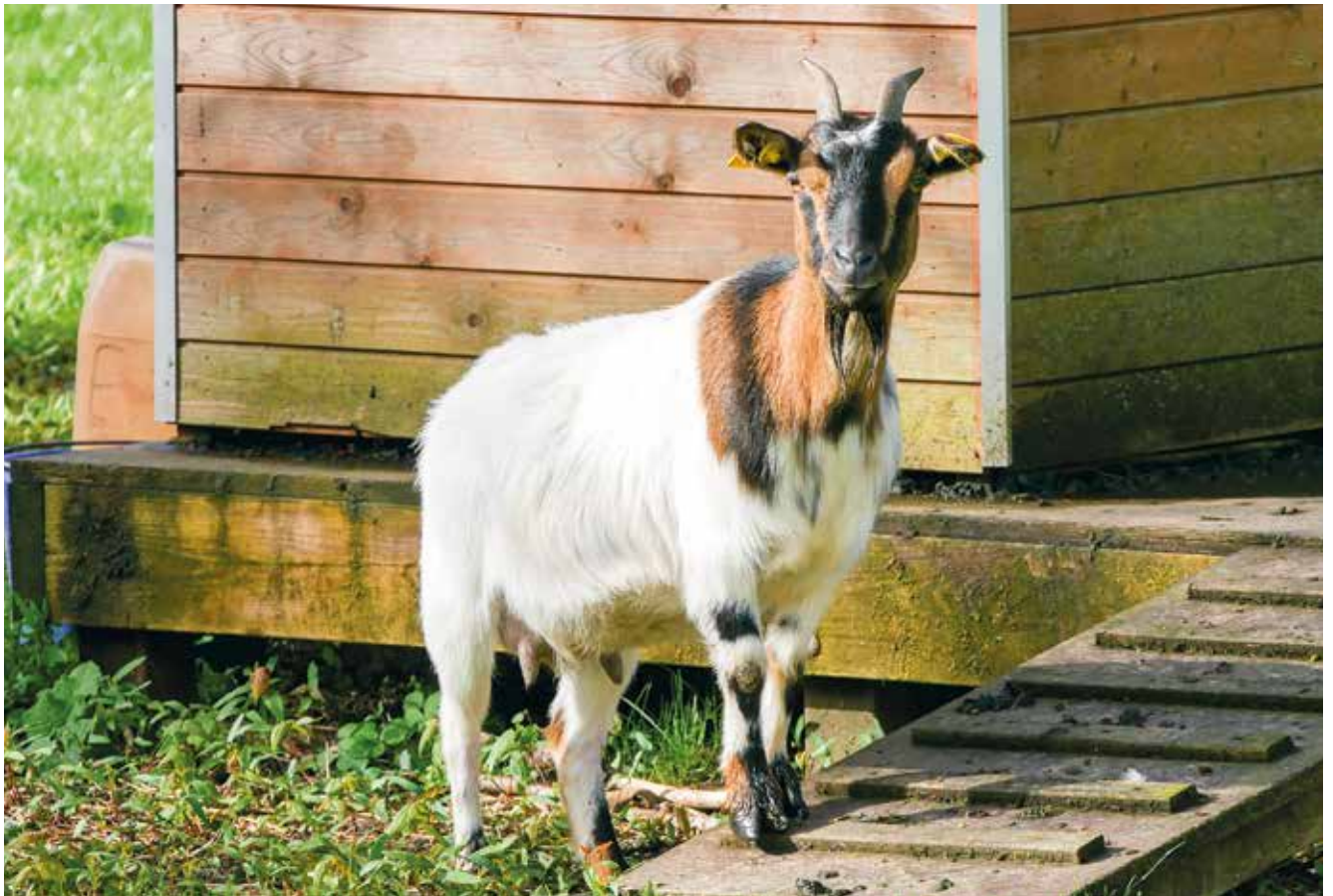
👉 C'est le printemps : les biquettes, les poules et les oies sont de retour dans leur enclos derrière l'hôtel de ville, pour le plus grand bonheur des enfants !