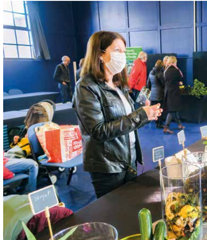
👉 Tous au compost : mardi 4 avril, la Ville a mis l'accent sur les composteurs partagés, avec sa ajoutant aux 4 existants. Un succès : plus de 60 personnes se sont inscrites à l'un de ces