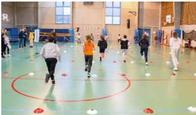
😊 Diagnoform : depuis 13 ans, Lambersart participe au Diagnoform qui mesure l'état de forme d'une génération. Ici ce sont les 6 e de Lavoisier qui sautent et qui courent !