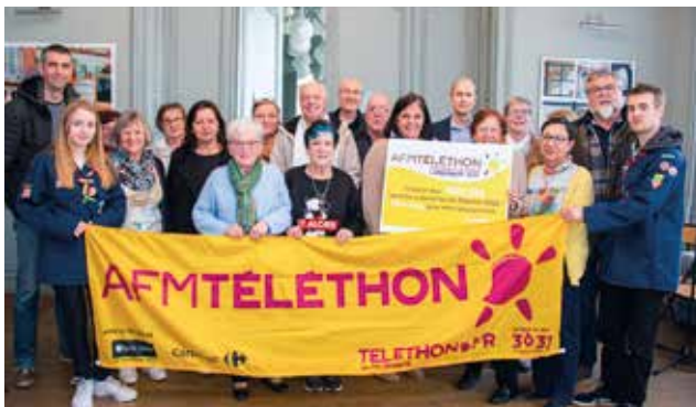
😊 Téléthon : après deux années en demi-teinte pour cause de Covid, le Téléthon repart de l'avant avec plus de 7800€ de dons des associations. Bravo et merci !