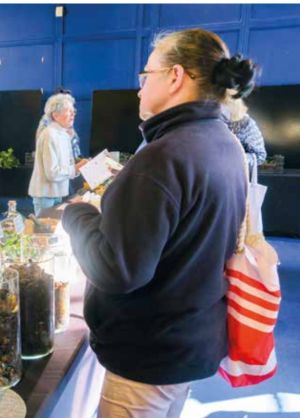
le lancement, lors d'une soirée conviviale de 3 nouveaux sites sites tout en apprenant plus sur le compost.