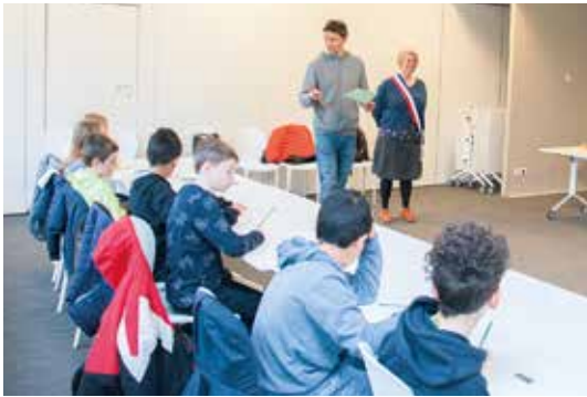
👉 Classe citoyenne : chaque année, les élèves de CM1 sont en immersion une semaine pour comprendre le fonctionnement de la vie démocratique, comme ici avec les enfants de Pasteur.