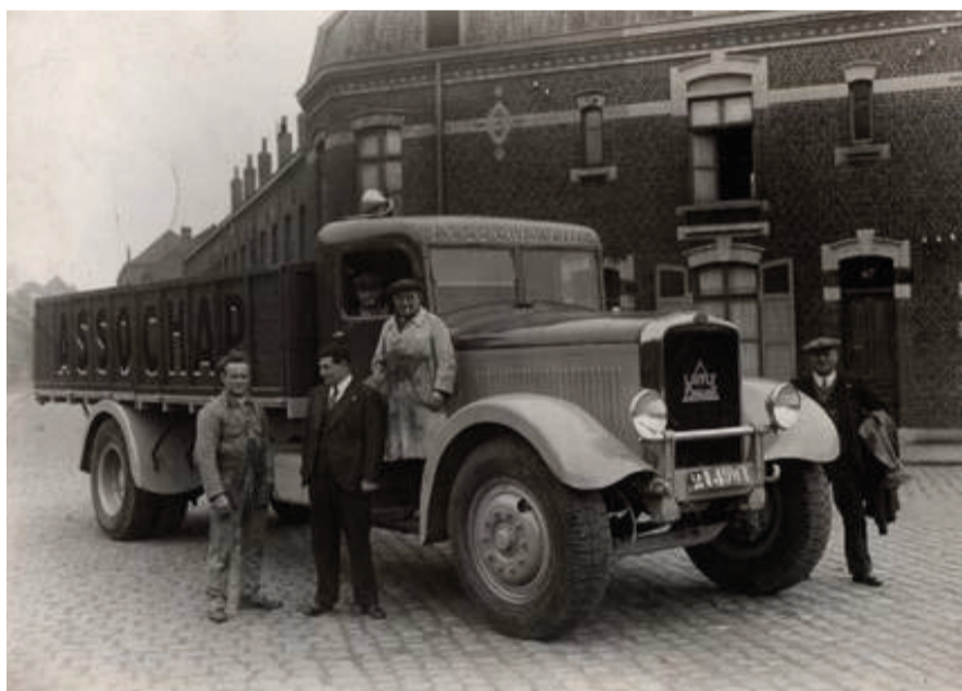
Camion des transports ASSOCHAR : Association Charbonnière de Lille--Roubaix-Tourcoing créée en 1935 par Constant Delattre. En 1972 le négoce de charbon derrière la rue Crespi est remplacé par la résidence du "Clos des érables" et "Canon d'or".