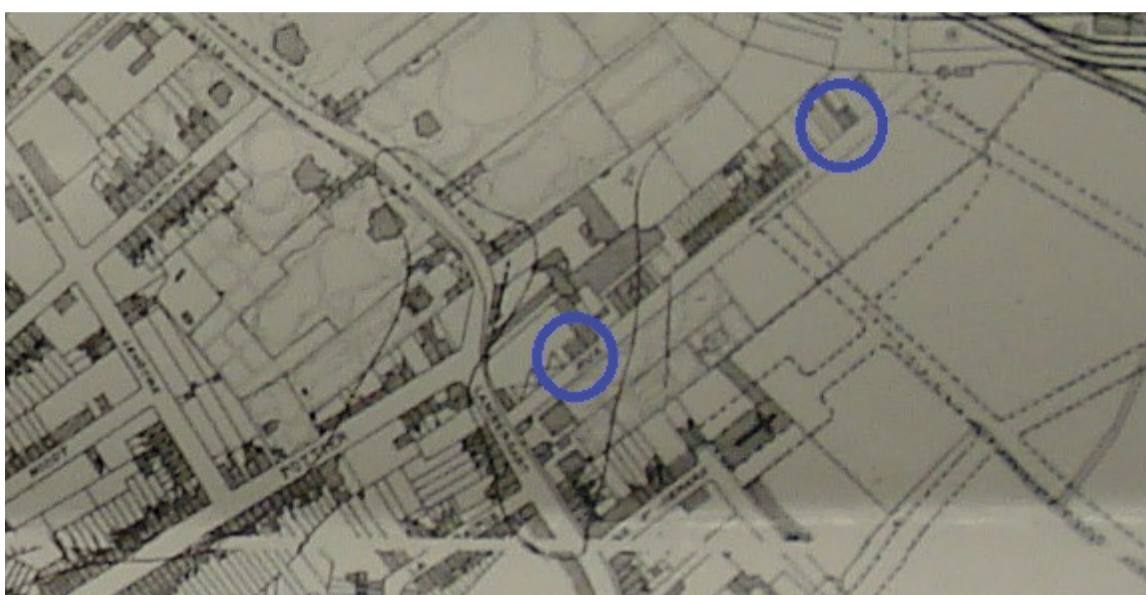
Plan de 1931 : les deux maisons hautes apparaissent dans la rue. La brasserie est remplacée depuis 1912 par une entreprise de transport de charbon, celle de Constant Delattre.