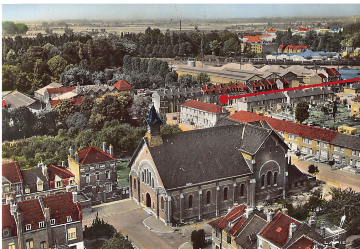
L'église St-Gérard vers 1960.