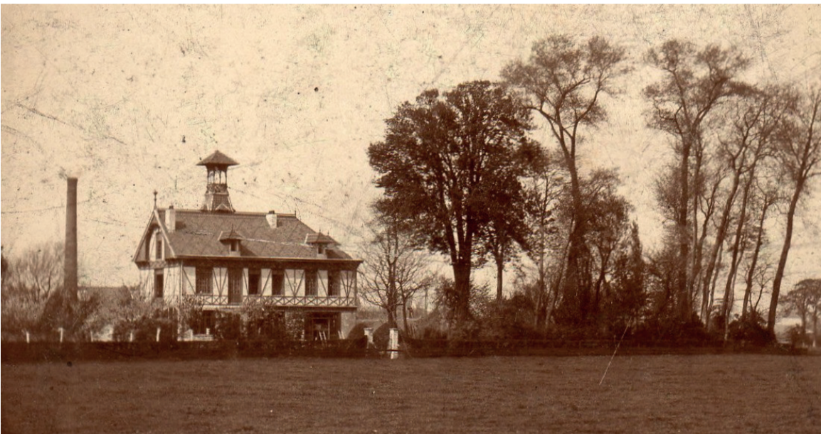
Castel Fleuri et cheminée de la brasserie vers 1890

Il habitait rue de Lille. La "rue Nouvelle" prend son nom en 1945