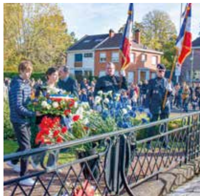
😊 11 novembre : l'armistice de 1918 commémoré par des centaines de Lambersartois le 10 novembre au soir et le 11 au matin.