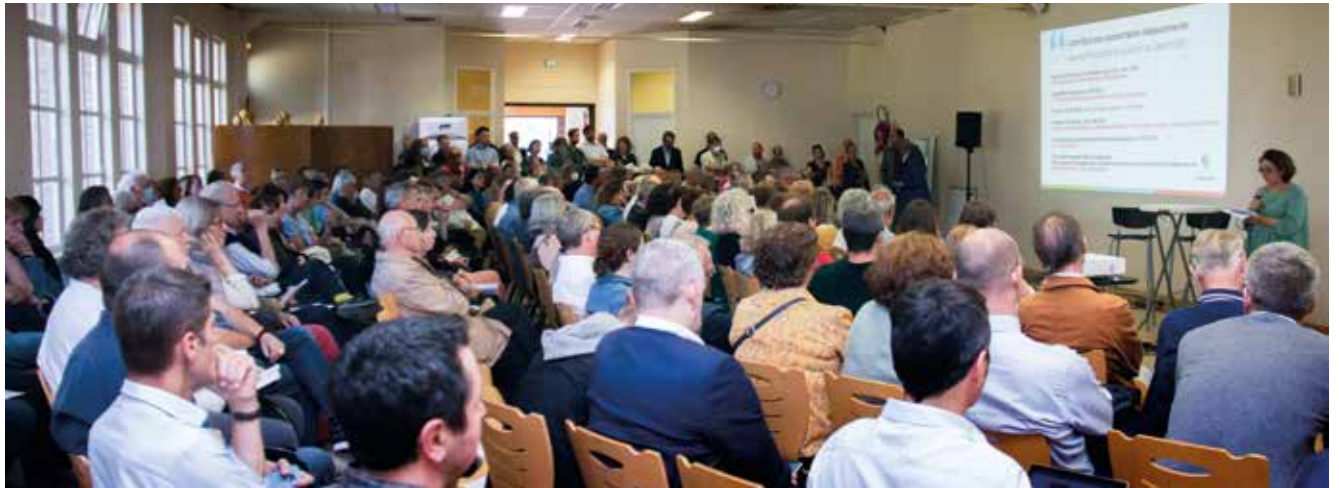
Réunion publique au Castel Saint-Gérard le 2 juin 2022