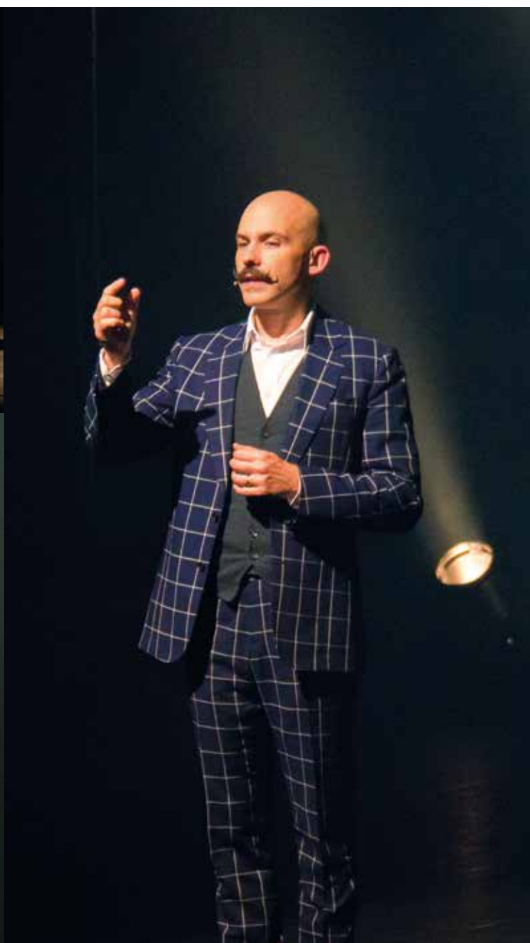
😊 Viktor Vincent : le mentaliste a fait salle comble pour le premier spectacle de la saison à la salle André-Malraux et les spectateurs ont été complètement bluffés par "Mental Circus".