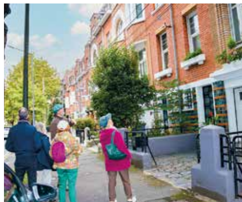
😊 Journées du patrimoine : plusieurs promenades à la découverte du patrimoine étaient proposées gratuitement.