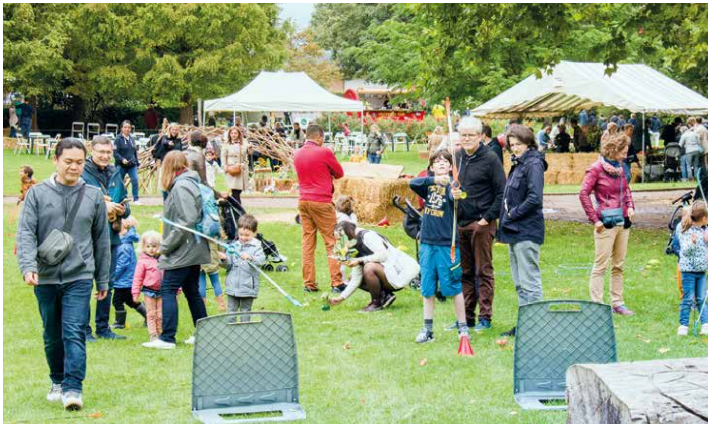
🌿 Fête de l'arbre : le 18 septembre, la grande fête familiale a mis à l'honneur l'arbre sous toutes ses formes au parc des Charmettes. Les ateliers de décoration, grimpe, jeux, balades ont