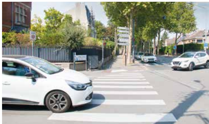
À l'angle de l'avenue Sainte-Cécile et de l'avenue de l'Hippodrome

Après la première réunion publique de concertation de juin au sujet de la circulation à Canteleu, la réflexion continue autour des deux sujets principaux : améliorer les liaisons de circulation au sein du quartier Canteleu et permettre une continuité cyclable et une fluidité améliorée du trafic avenue de l'Hippodrome. Une nouvelle réunion de concertation, aura lieu mardi 18 octobre à 20h au centre Jules-Maillot.