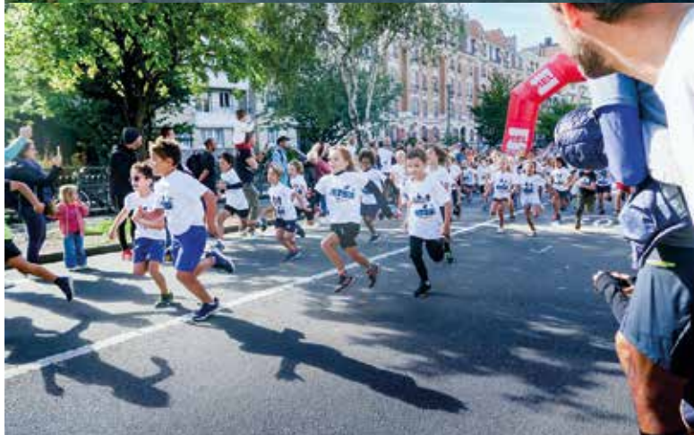
😊 36 e Foulées lambersartois : près de 1 200 coureurs ont participé aux différentes courses sous le soleil et dans une ambiance très conviviale. Merci aux nombreux bénévoles impliqués !