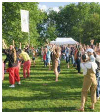
😊 Bal des Abysses : dans le cadre de lille3000 Utopia, on a dansé le 21 mai sur la plaine du Colysée à l'invitation de la cie Pernette.