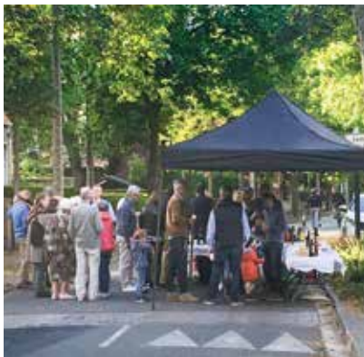
😊 Fête des voisins : c'était le retour des apéros et auberges de rue le 20 mai, sous le soleil!