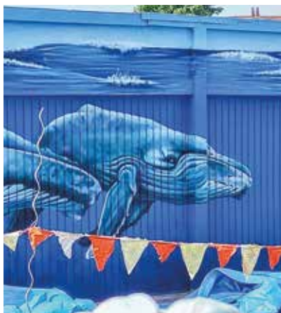
😊 Canon d'Or : dans le cadre des Fenêtres qui parlent, l'artiste Iksté a peint les portes des garages du sentier du Canon d'Or.