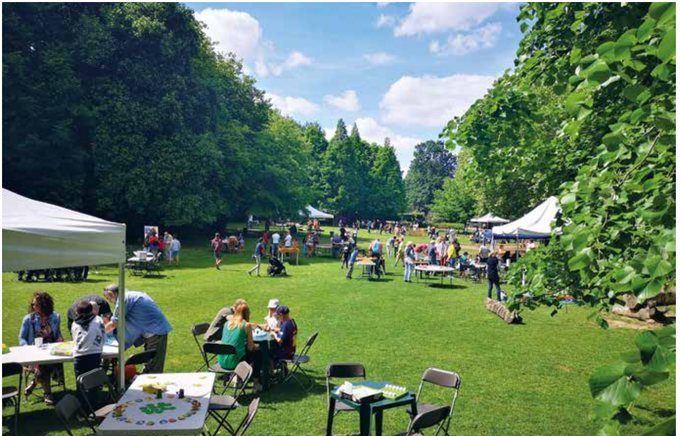
😊 Fête du jeu : de nombreuses animations ludiques étaient proposées au parc des Charmettes samedi 21 mai.