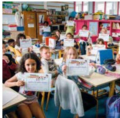
😊 Diplôme piéton : les CE2 de l'école Louise-de-Bettignies arborent avec fierté leur diplôme.