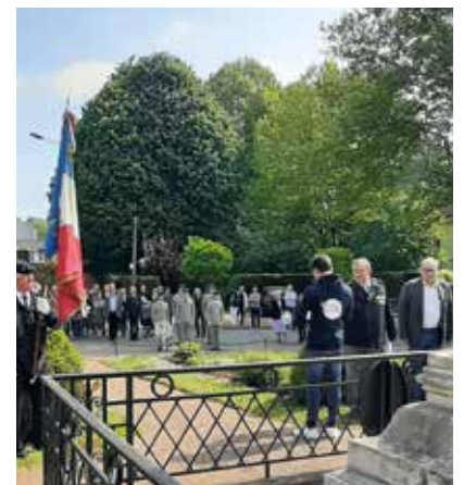
😊 Cérémonie du 8-Mai : on a célébré sous le soleil le 77 e anniversaire de la Victoire du 8-Mai-1945.