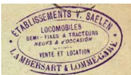
En-tête de courrier de 1954 avec usine de Lambersart ->