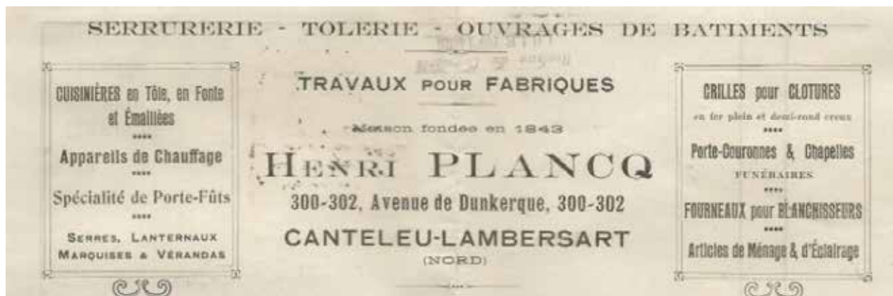
Maison fondée en 1843 comme le stipule cet en-tête de courrier de 1925

● SOMMAIRE : p1 : Plancq et Millécamps, serruriers fondeurs avenue de Dunkerque - dossier : matériel et engins agricoles Saelen au Bourg puis Canteleu - p4 : blanchisseries Val et Desreumaux à Canteleu