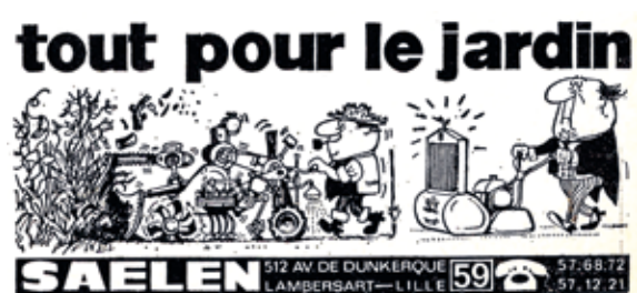
Le bâtiment industriel n°15 à 23 avenue de Boufflers ex-Saelen SA (enseigne sous la peinture blanche) en 2010 avant l'arrivée des pompes funèbres Bourrez - Publicité de 1967 dans le magazine municipal

chaudronnerie O. Fontaine, occupant jusque 1963 puis magasin alimentaire en gros jusque 1972 (pompes funèbres Bourrez et marbrerie funéraire Camossaro depuis 2013). Victor Saelen avait racheté le bâtiment en 1943 à Deltour (SCI La Semeuse), Avon en récupère l'occupation. Saelen est rachetée en 1986 par un groupe, qui transfère son activité à Lesquin, puis Ronchin en 2001. « Spécialisée dans la fabrication de broyeurs multi-végétaux et la distribution de machines pour l'entretien des espaces verts, Saelen Distribution se compose de 7 marques partenaires exclusives apportant une expertise pour des solutions au plus près des besoins du terrain. » (site internet actuel)