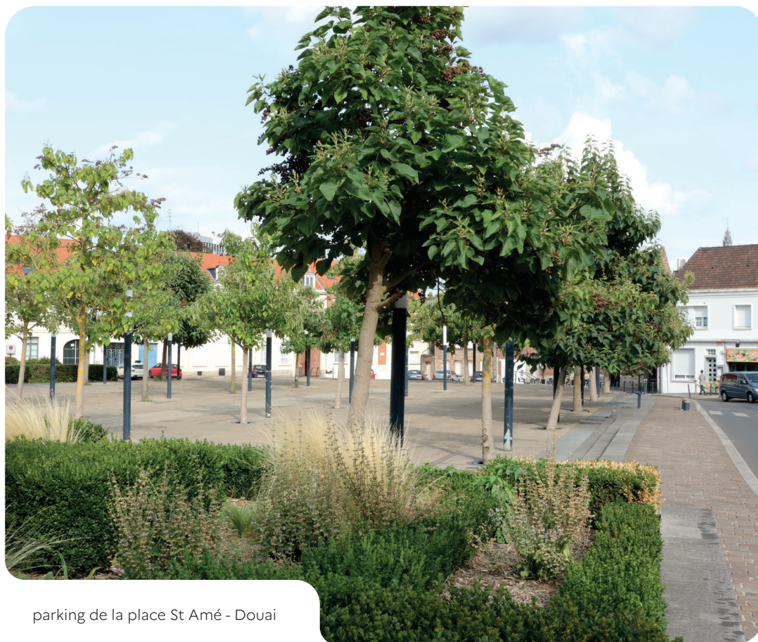
parking de la place St Amé - Douai

Elle décrit les actions dans lesquelles s'engage la collectivité pour favoriser la mise en œuvre d'un entretien des espaces publics respectueux de notre ressource en eau et de la biodiversité.