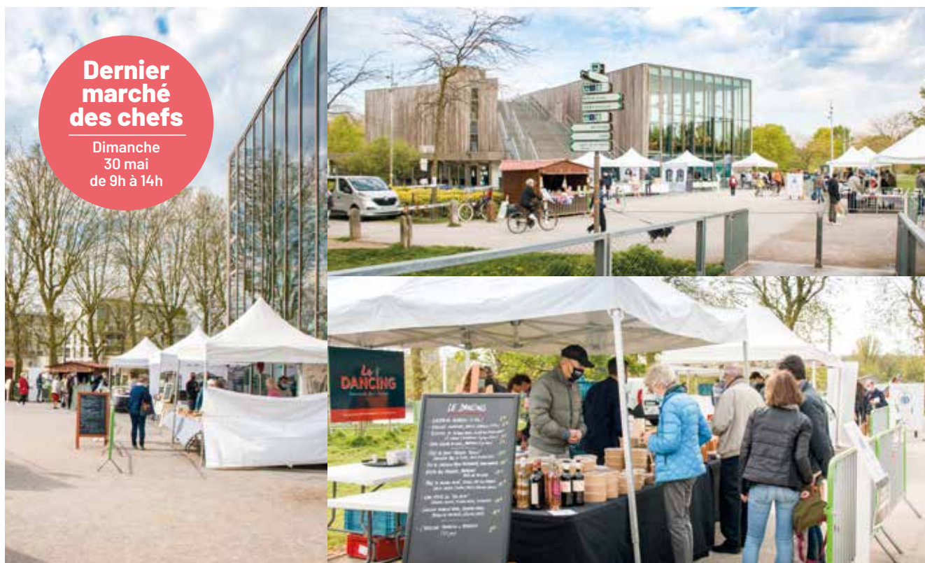
😊 Marché des chefs : le 9 mai, c'était encore un beau succès pour les restaurateurs lambersartois. Prochain et dernier marché des chefs, dimanche 30 mai, toujours près du Colysée.