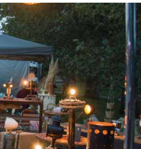
Marché nocturne sur les berges de la Deûle.

Ouverture du mardi au dimanche, de juin à septembre.