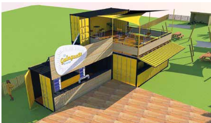
Projet de la Guinguette de la plage.