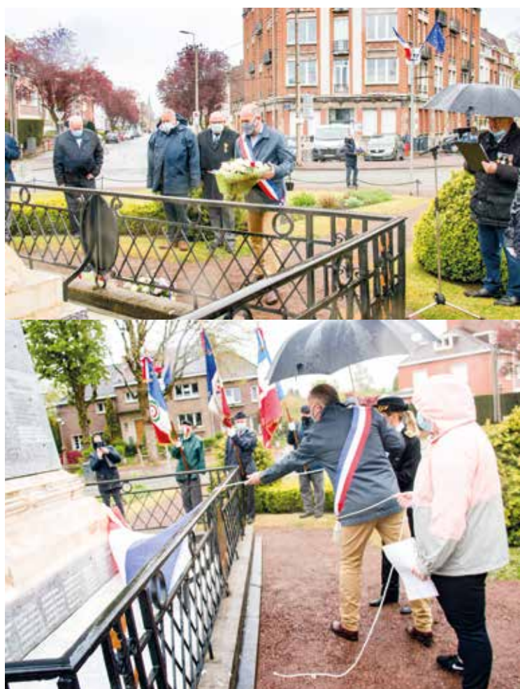
😊 76 e anniversaire du 8 mai 1945 : à l'occasion de cette cérémonie commémorant la Victoire à la fin de la Seconde Guerre mondiale, une plaque reprenant 26 noms de morts oubliés a été dévoilée.