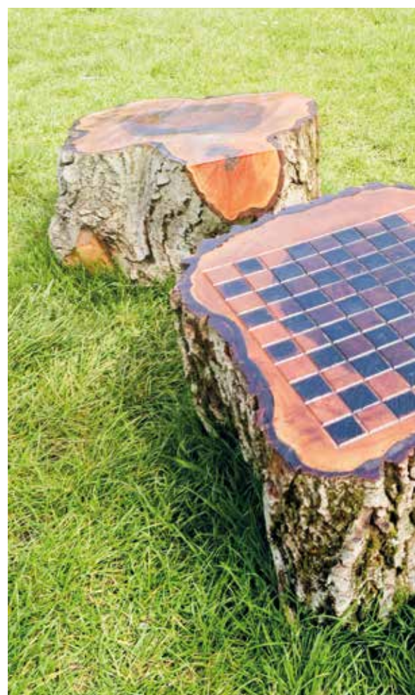
😊 Echec et mat : c'est nouveau ! venez vous installer avec votre jeu d'échecs ou de dames sur les berges de la Deûle, tout est prévu !