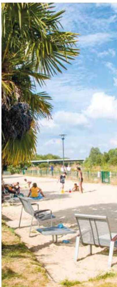
Profitez de la plage pour vous détendre.

Réservations : arena@ville-lambersart.fr ou au 06 40 82 81 16 (du lundi au vendredi de 9h à 17h et pendant les heures d'ouverture public). Le planning des réservations est consultable en ligne à www.lambersart.net/grr . Les associations lambersartoises peuvent réserver la structure pour l'organisation de tournois après validation d'un protocole d'organisation respectant les conditions sanitaires en vigueur.