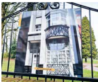
Exposition Lambersart Art déco 2021 - Parc des Charmettes

Sur les grilles du Parc des Charmettes, avenue de Verdun, 21 panneaux présentent un panel photographique de l'Art déco à Lambersart, villas, immeubles ou portions de rue Art déco, ainsi que les éléments de décoration typiques : ferronnerie, vitraux, céramiques, décors en béton armé ou ciment peint... Jusqu'au 26 septembre.