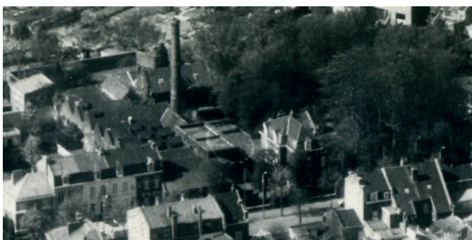
Vue aérienne vers 1975