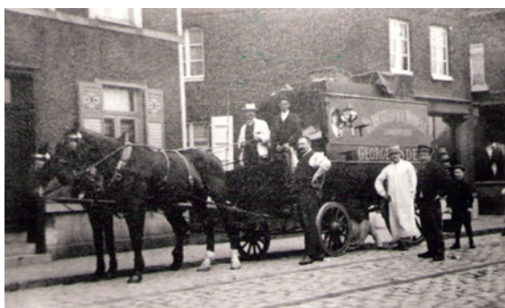
Ramassage du linge sale vers 1910

Après le décès de Georges en 1911, la blanchisserie est dirigée par sa veuve, Alice née Herrent (1879-1947) associée à son frère Amédée, qui décède en 1950. Sa veuve décède en 1966 et l'usine arrête alors son activité. Après qu'elle soit rasée au n°36, comme la villa au n°34, la résidence du Clos de Cagny est construite avenue de Boufflers en 1997.