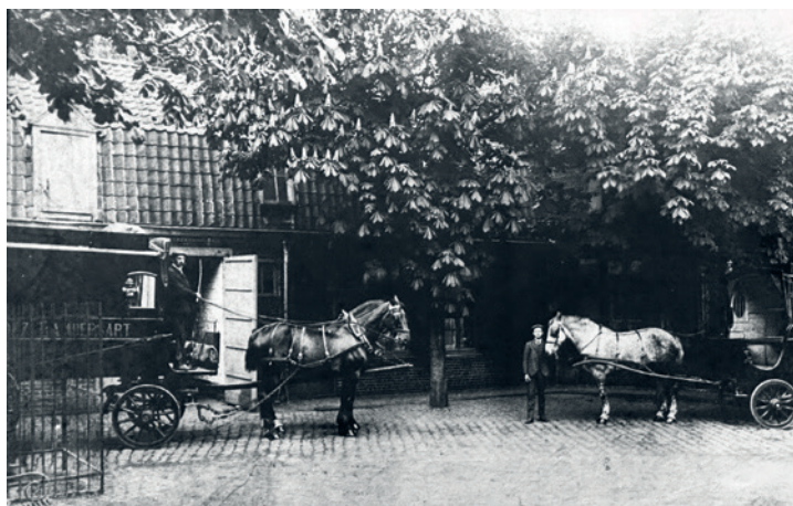
Livraison de linge vers 1900 de la blanchisserie de Lambersart Sdez